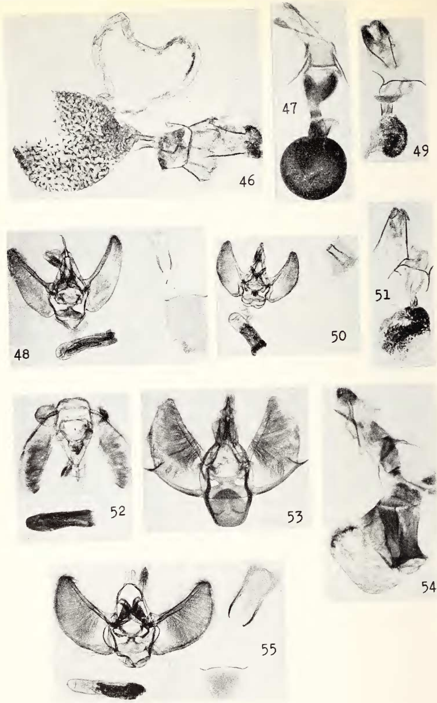
Planche VI. fig. 46 costisignata ♀ prép. 1659.2. D.L. x15 fig. 47 emanata ♀ prép. 1950.595. x15 fig. 48 hilarjata ♂ prép. 1657.1. D.L. x15 fig. 49 hilarjata ♀ prép. 1657.2. D.L. x15 fig. 50 illaborata ♂ prép. 1658.2. x15 fig. 51 illaborata ♀ prép. 1658.3. D.L. x15 fig. 52 lucigera ♂ prép. 3519 x15 fig. 53 recens ♂ prép. 1950.593A x15 fig. 54 recens ♀ prép. 1656.1. D.L. x15 fig. 55 rubellata ♂ prép. 1653.3. D.L. x15